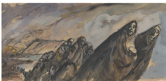
Eugen Nevan: Ústup