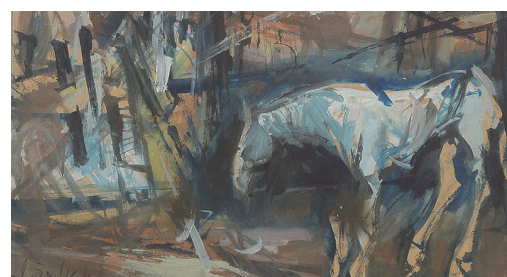
Vincent Hložník: Osamelý kôň